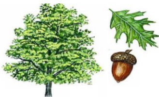
blad en eikel van Amerikaanse eik

Verder willen we de ouders die meegelopen hebben met de herfstwandeling heel hartelijk bedanken. Het was een leuk uitje en het was gelukkig droog weer!