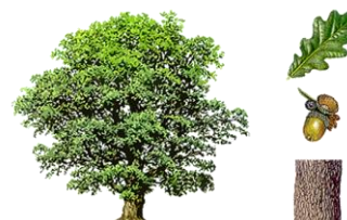
blad en eikel van Nederlandse eik