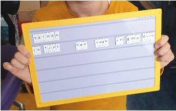
Salman: ik fint het leuk in goep drie