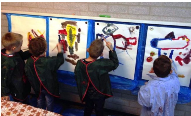
Leerlingen van groep KC aan het werk.